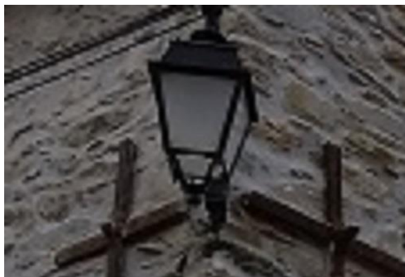
N°181948 avec le support petite lanterne