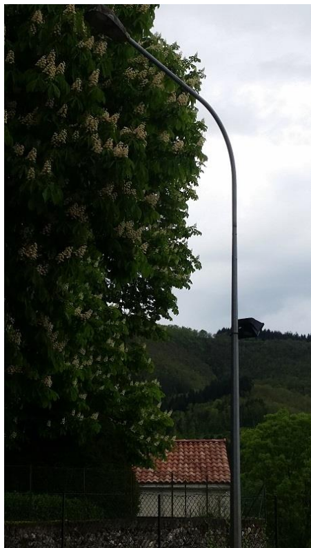
N° 152456 Pylone + lampe